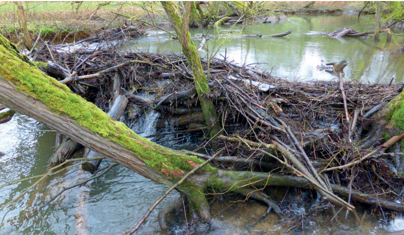
Staudamm am Simmerbach

Dank uns Biber sind viele Arten zurückgekehrt