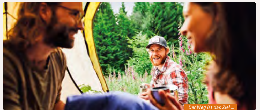
Der Weg ist das Ziel ...

» Ausstattung: 5 Zeltplätze, 1 Gruppenzeltplatz, Feuerstelle, Sitzmöglichkeiten, Toilette | Hinweise: Kein Trinkwasser, keine Verpflegungsmöglichkeiten, keine Müllbehälter/-säcke vor Ort | Öffnungszeiten: 01. April - 31. Oktober | Buchungsgebühr: 15 € pro Zelt/Nacht, 20 € pro Gruppenzeltplatz/Nacht | Anreise: nur zu Fuß möglich, GPS-Koordinaten werden nach Buchung bekannt gegeben | Buchung: www.soonwaldsteig.de/trekkingcamps/buchung