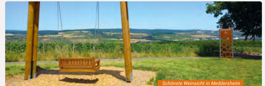
Schönste Weinsicht in Meddersheim

» Treffpunkt: in Bad Kreuznach, wird bei der Anmeldung bekannt gegeben | Dauer: ca. 1,5 Stunden | Kosten: Spende willkommen | Hinweis: Bei Regen bleiben die Fledermäuse zu Hause und die Veranstaltung muss leider ausfallen | Info und Anmeldung: NABU.BadKreuznach@NABU-RLP.de