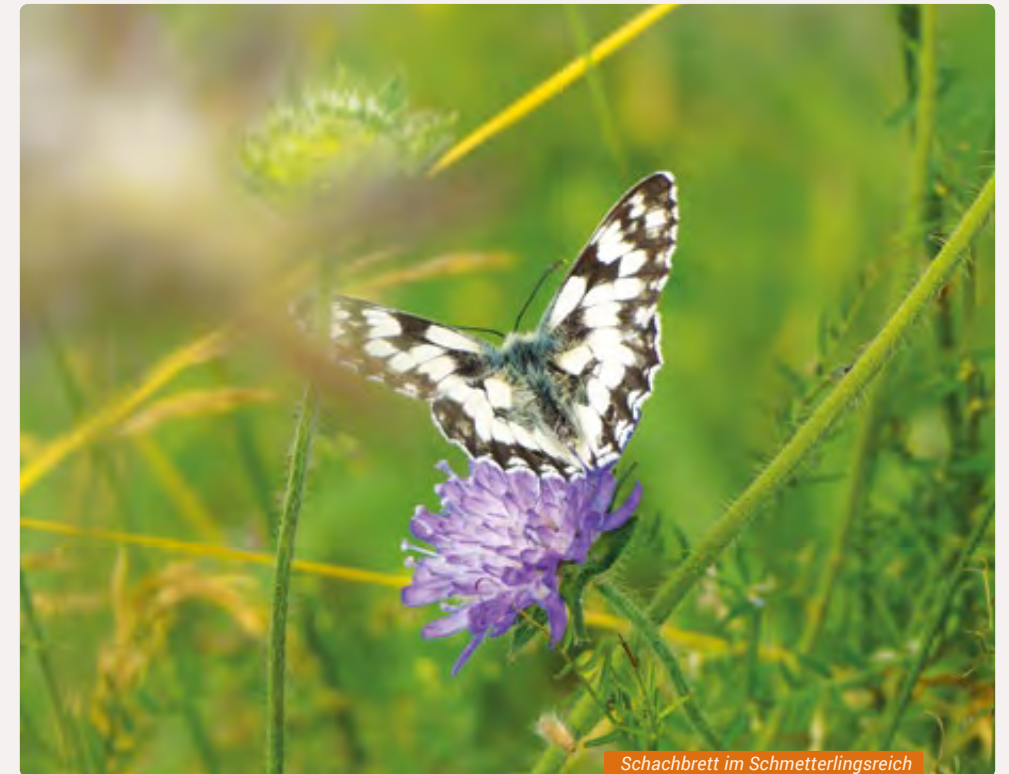
Schachbrett im Schmetterlingsreich

» Treffpunkt: Parkplatz an der Altenbaumburg bei Altenbamberg | Zielgruppe: Familien und Kinder im Alter von 7-12 Jahren | Kosten: keine | Anmeldung: Forstamt Bad Sobernheim, Tel. 06751 857990, forstamt.bad-sobernheim@wald-rlp