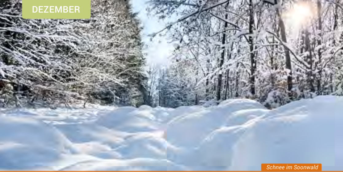
Schnee im Soonwald