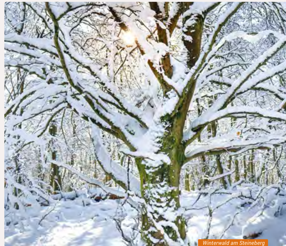
Winterwald am Steineberg