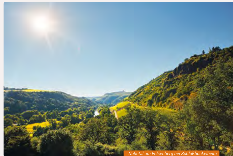
Nahetal am Felsenberg bei Schloßböckelheim