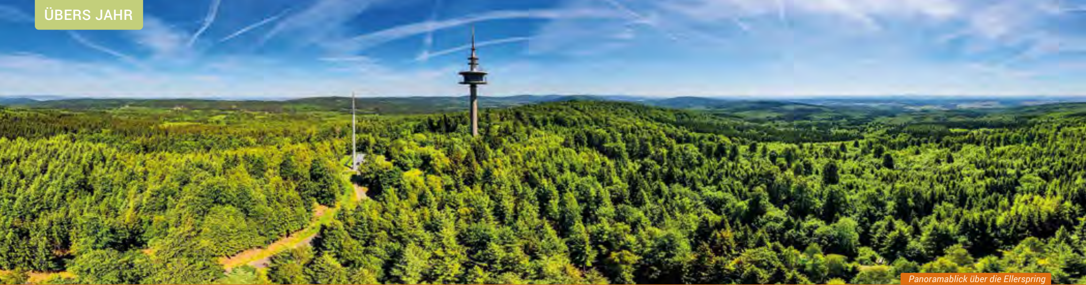
Panoramablick über die Ellerspring