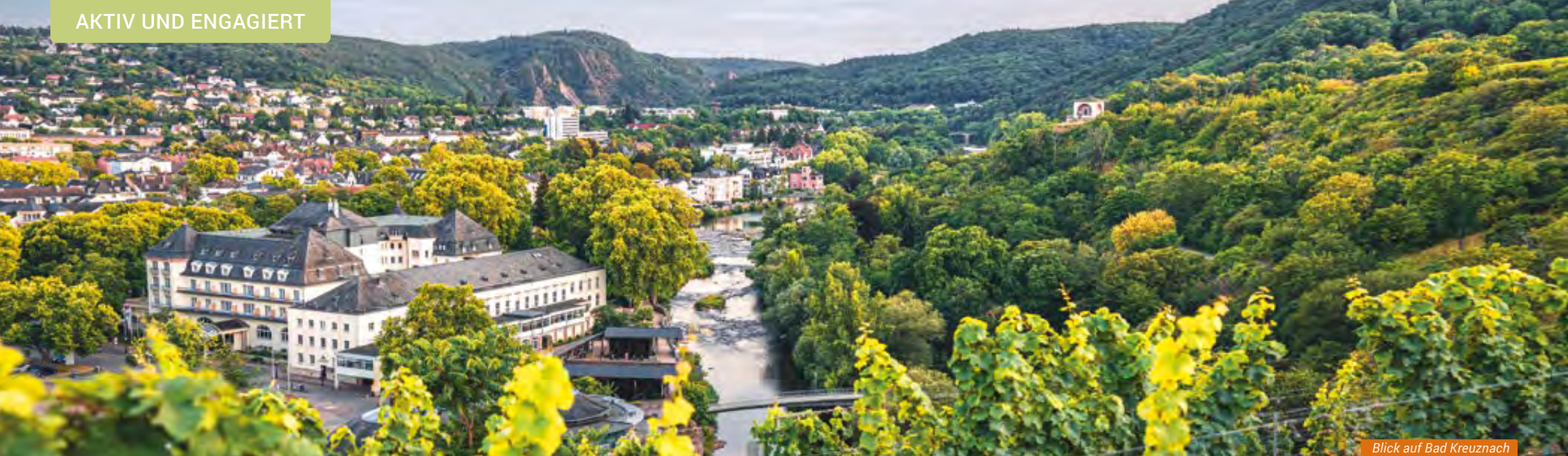
Blick auf Bad Kreuznach