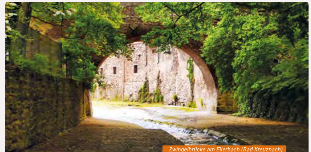
Zwingelbrücke am Ellerbach (Bad Kreuznach)

» Kosten: 15,00 € pro Person | Teilnehmer: Mind. 10 Personen | Info und Anmeldung: Heike Kinkel, Tel. 06707 1626, h.kinkel@kuweibo-nahe.de