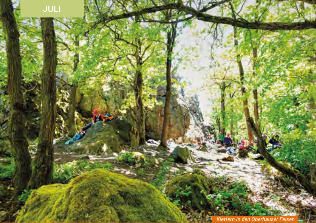
Klettern in den Oberhauser Felsen