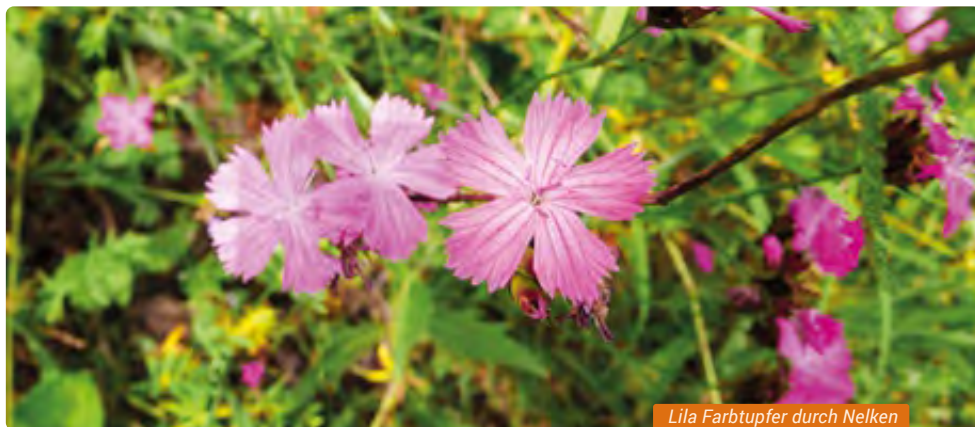
Lila Farbtupfer durch Nelken