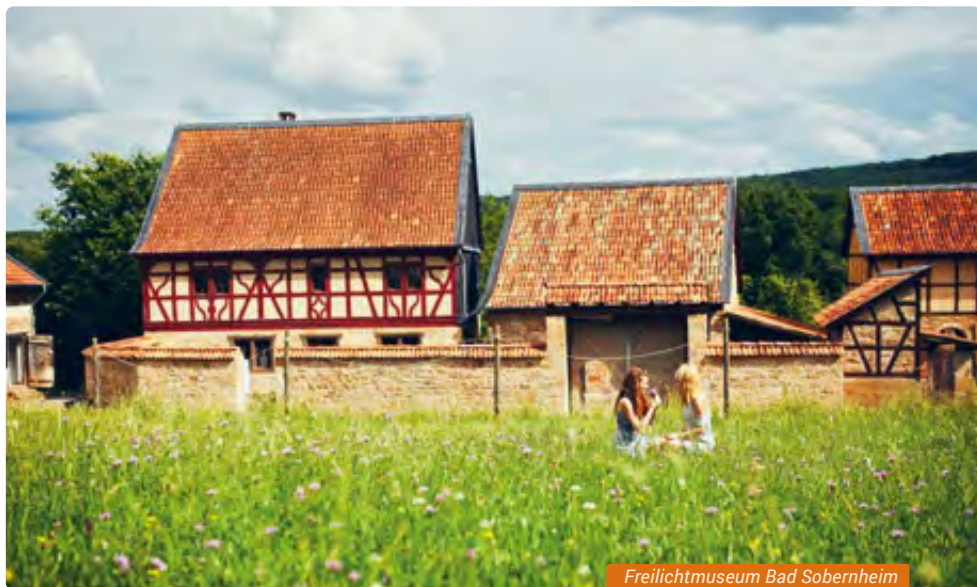
Freilichtmuseum Bad Sobernheim

» Info: Rheinland-Pfälzisches Freilichtmuseum Nachtigallental 1 55566 Bad Sobernheim, Tel. 06751 855880, www.freilichtmuseum-rlp.de