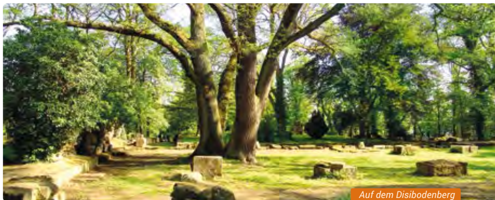
Auf dem Disibodenberg