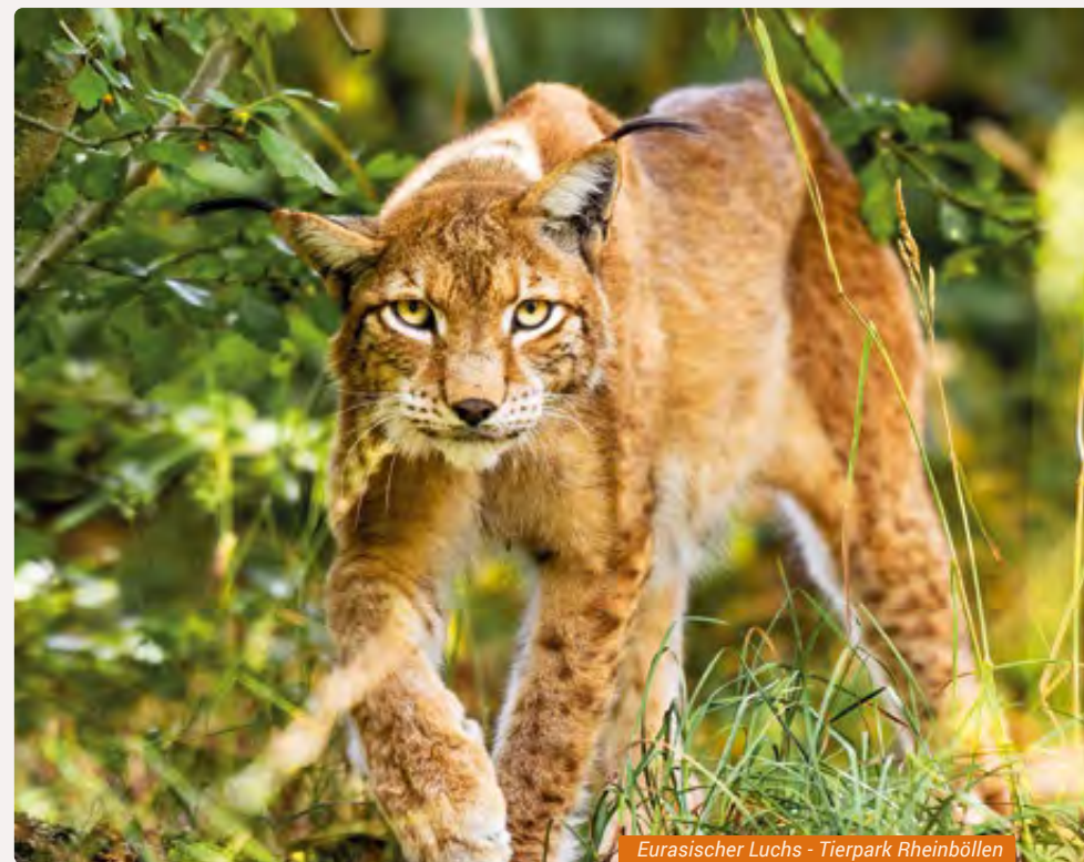
Eurasischer Luchs - Tierpark Rheinböllen