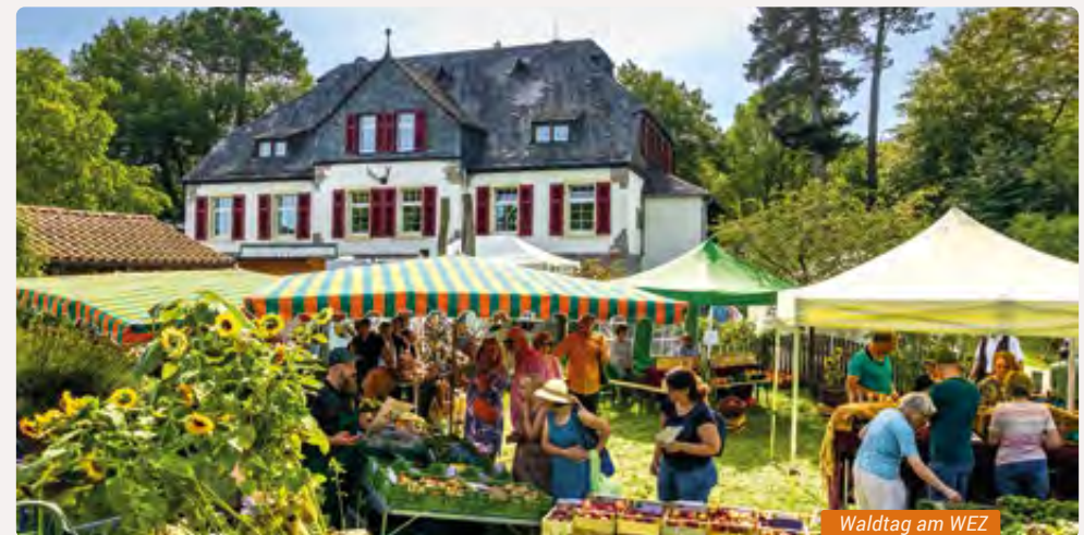
Walddag am WEZ

» Weitere Infos, Veranstaltungen und Öffnungszeiten: Waldladen, Neupfalz 1, 55444 Schöneberg, Tel. 06131 884267900, www.walderlebniszentrum.wald-rlp.de