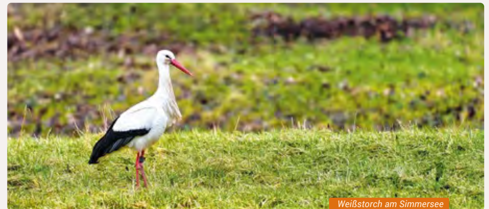
Weißstorch am Simmersee

» Ort: Bad Sobernheim, Nachtigallental | Dauer: ganztägig | Kosten: Eintritt Freilichtmuseum | Anmeldung nicht erforderlich