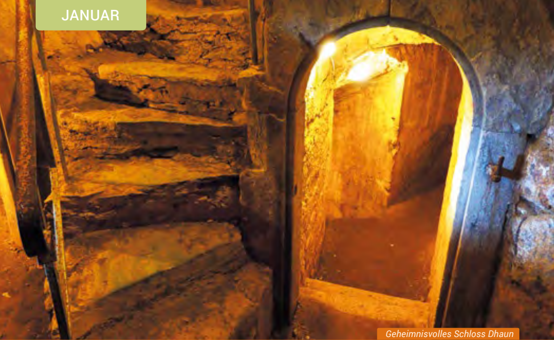
Geheimnisvolles Schloss Dhaun