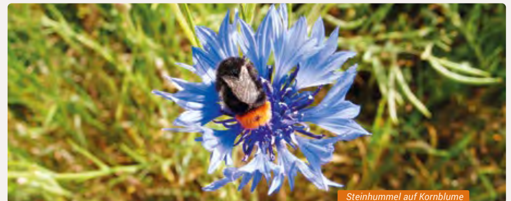
Steinhummel auf Kornblume

» Info: Familie Beicht, Telefon: 06765 311, wiesplacken@hotmail.de