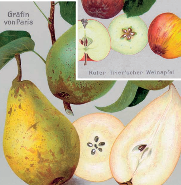
Gräfin von Paris

BUND Lemgo design bruno bolli Obstsortendatenbank.de