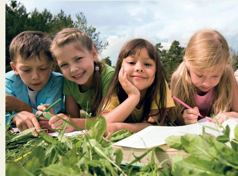
Text: Annika Horstik, VDN