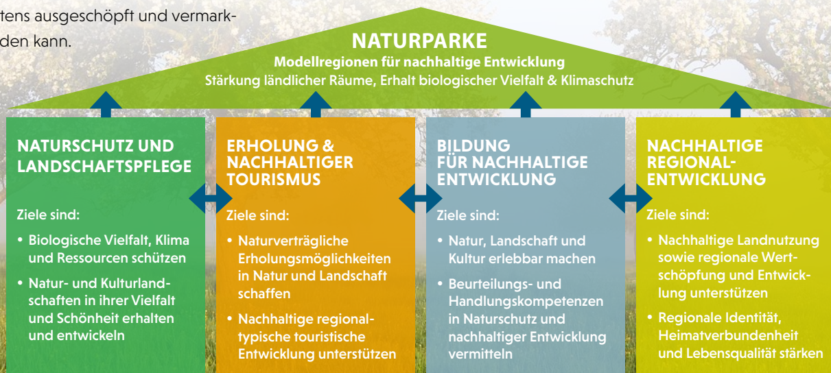
Abbildung verändert auf Grundlage des Wartburger Programms der Naturparke in Deutschland (VDN, 2018)

Der Verband Deutscher Naturparke legte mit dem Wartburger Programm seine bundesweit abgestimmten Ziele und Aufgaben der deutschen Naturparke vor. Auf dieser Grundlage und in Verbindung mit dem Bundesnaturschutzgesetz richten die Naturparke ihre Aktivitäten an den vier Handlungsfeldern Naturschutz, Erholung, Bildung und Regionalentwicklung aus.